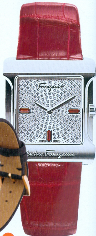
Salvatore Ferragamo $39,500